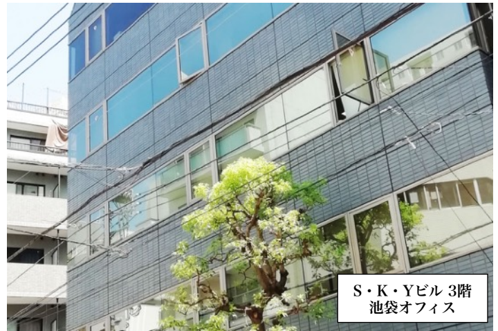
S・K・Yビル3階 池袋オフィス