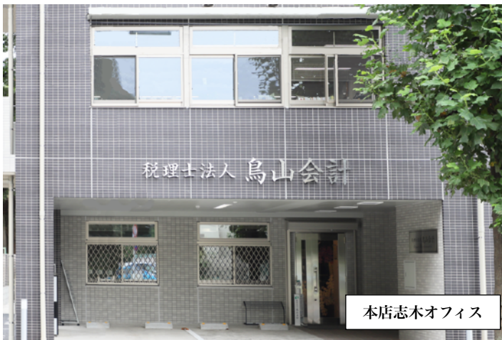
本店志木オフィス